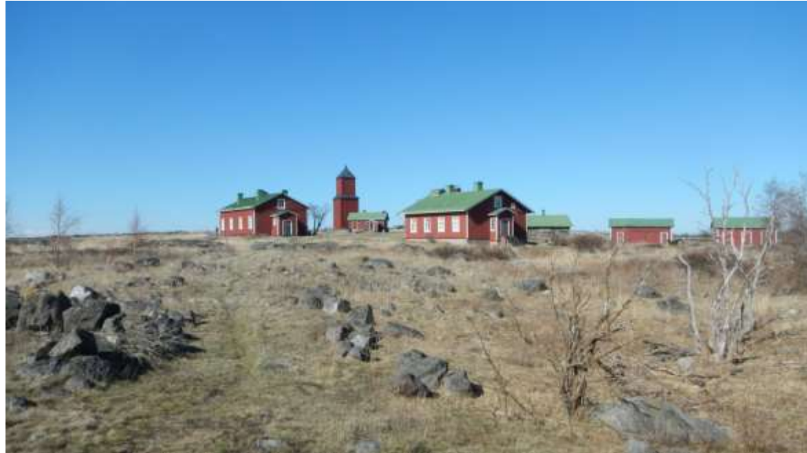
Rönnskär, Fäliskär.