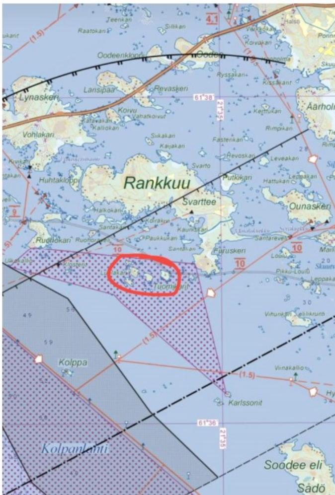
Kuva 1 Pyydyspaikat kartalla