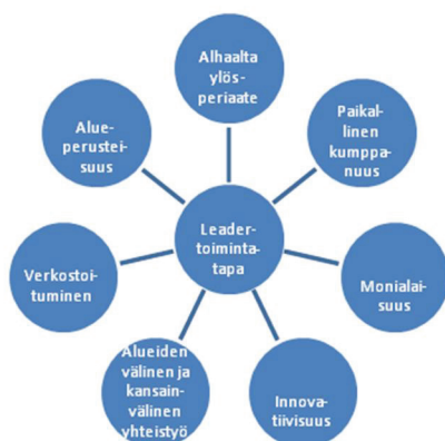
Kuva 8. LEADER-periaatteet, joihin paikallinen kehittäminen pohjautuu (Manner-Suomen maaseudun kehittämisohjelma 2014-2020 luonnos).

Paikallista kehittämistä rahoitetaan Etelä-Savon maaseudun kehittämisohjelmassa pääsääntöisesti toimintaryhmätyöllä ja LEADER-menetelmällä. Etelä-Savon kehittämissuunnitelman tässä vaiheessa varsinaista hakua toimintaryhmiksi ei ole vielä avattu. Parhaillaan tätä työtä alueella tekevät neljä toimintaryhmää: Rajupusu LEADER ry, Veej’jakaja ry sekä Piällysmies ry sekä Päijänne Leader ry, joista jokainen on alustavasti hakenut viralliseksi toimintaryhmäksi. Näistä jälkimmäinen toimii Pertunmaalla ja kuuluu Hämeen ELY-keskuksen alueelle. Toimintaryhmien alueiden asukasluku vaihtelee 19 000 - 55 000 asukaaseen.