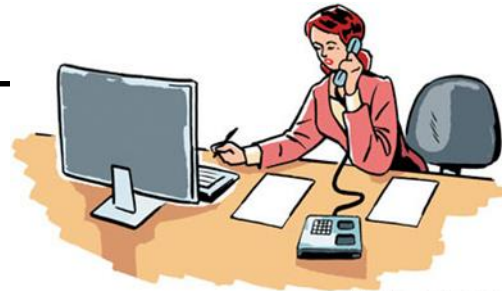
Illustration by Chris Gash