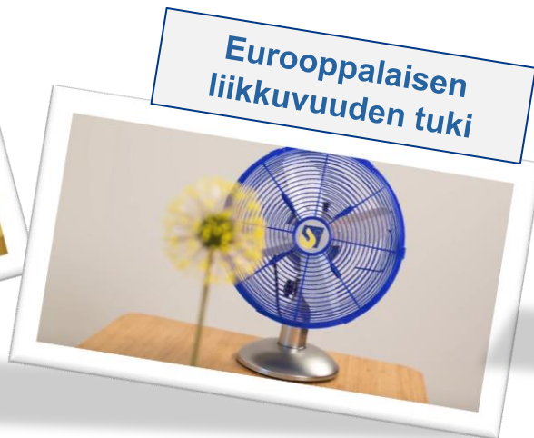
Eurooppalaisen liikkuvuuden tuki