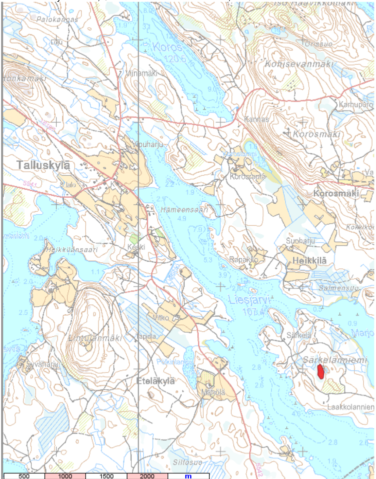
Kartta: Lähestymiskartta, Oulunlammin kalastuskieltoalue, Tervo.