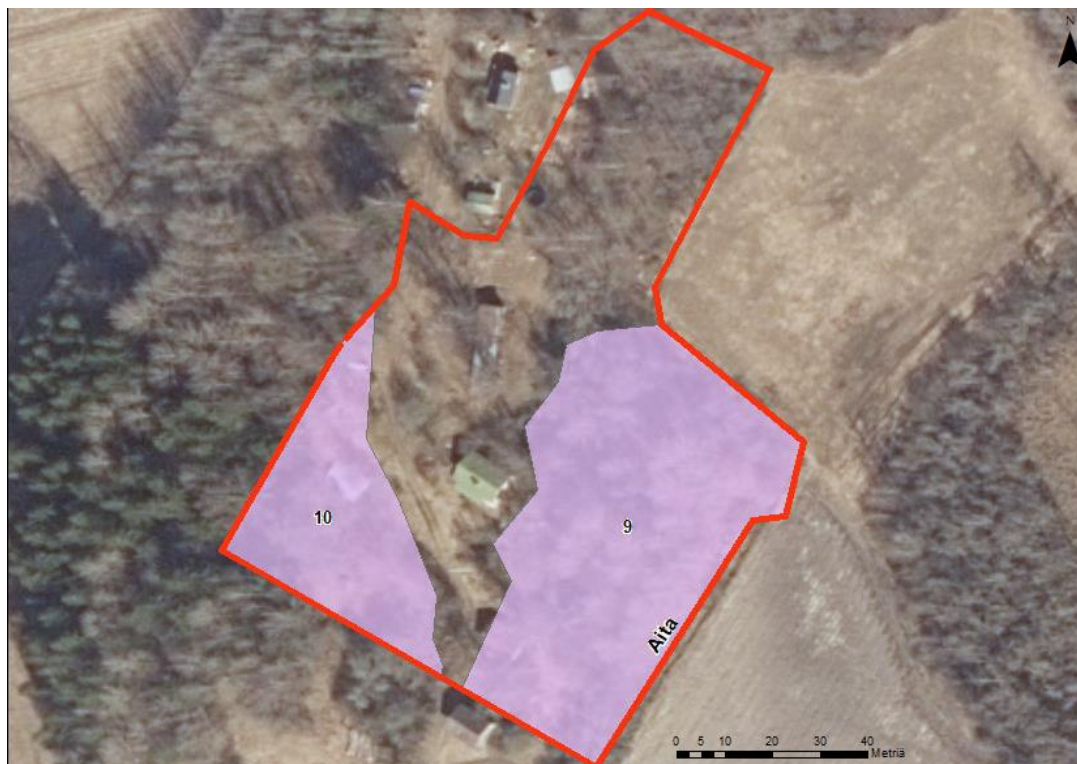
Kuva 1. Mahdollinen aitalinja ja toimenpidekuviot raivauksille ja puunpoistoille.

Maanomistaja suostuu siihen, että alueelle tehdään kunnostustöitä ja tuleva laiduntaja rakentaa alueelle laidunaidan, sekä raivaa alueelta puustoa. Aluetta saa lisäksi laiduntaa ja laiduntaja saa hakea alueelle ympäristösopimuksen, jonka kesto on vähintään viisi vuotta.