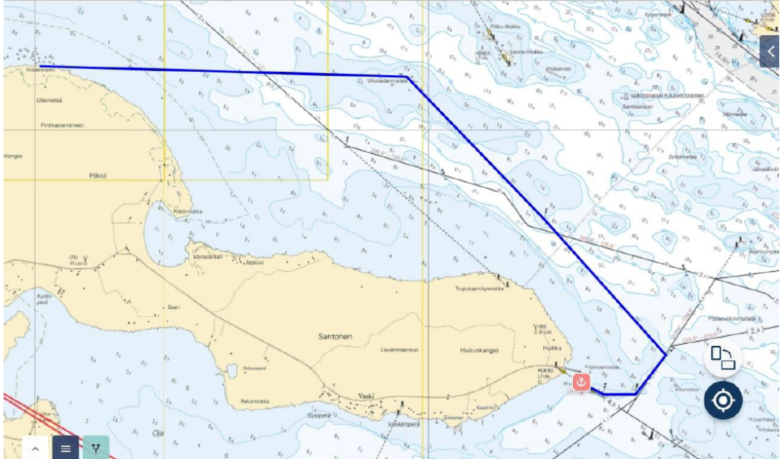
Liite 1. Troolikalastuskieltoa koskeva vesialue (merkattu sinisellä viivalla)