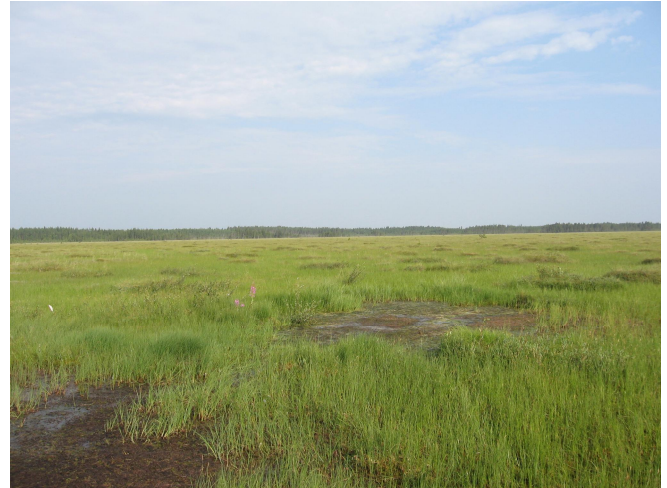
Rimpipintaista nevaa. Seinäjoki.

Nämä sijoittuvat erityisesti Maalahden, Mustasaaren ja Vöyrin kuntiin rannikon läheisille alueille.