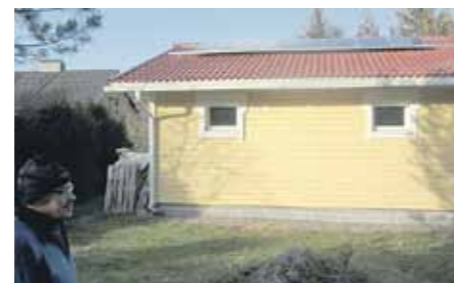
Imatralainen Erkki Kosonen saa osan sähköstä autotallin katolle viritettyjen aurinkopaneelien avulla.

Etelä-Karjalan Kärki-LEADER ry - Uusia haasteita Kustannusarvio: 110 380 € Julkinen rahoitus: 110 380 € Lappeenrannan teknillinen yliopisto - Miten parantaa energiaomavaraisuutta Kustannusarvio: 40 000 € Julkinen rahoitus: 36 400 € Yksityinen rahoitus: 3 600 € Tuen myöntäjä: Etelä-Karjalan Kärki-Leader