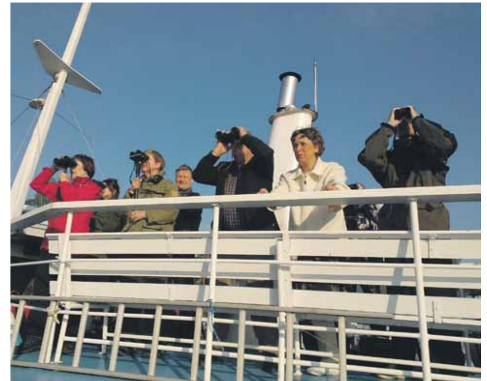
Arktika-risteilyt olivat uusi tuote, jonka VILUKKO kehitti Virolahden Arktika-päiville ensimmäistä kertaa 2013.

Luontoteemaa toteutettiin lähinnä Arktika-päivien kehittämisen kautta. Virolahden luontomatkailun merkittävin tapahtuma, lintujen arktiseen muuttoon ajoittuvat Arktika-päivät