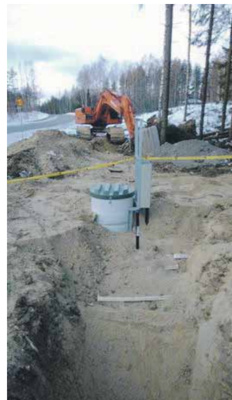
Linjapumppaamo Rantatien varressa.

Jänhiälän vesihuolto-osuuskunta perustettiin heinäkuussa 2012. Yhteisverkoston rakentamissuunnitelma valmistui v. 2013 aikana, ja verkoston rakentaminen alkoi samana vuonna. Hankkeessa rakennettiin alueelle sekä puhtaan veden että jäteveden verkosto. Syksyllä 2014 valmistuneeseen verkostoon liittyi 44 kiinteistöä.