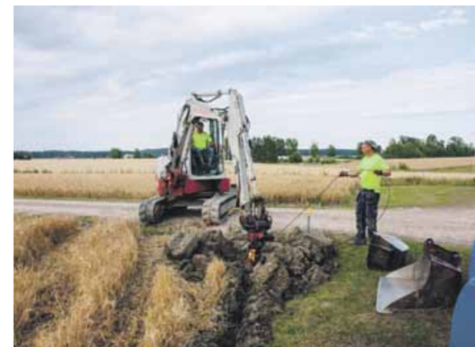
Valokuitukaapelin kaivuutyöt Elimäellä. Kuva Kymijoen Kyläkuitu.

Kyläkuidun tarkoituksena on edistää jäsentensä nopeita ja luotettavia tietoliikenneyhteyksiä ja nykyaikaisen tietoliikenneverkon antamin edellytyksin tukea kestävää kehitystä.