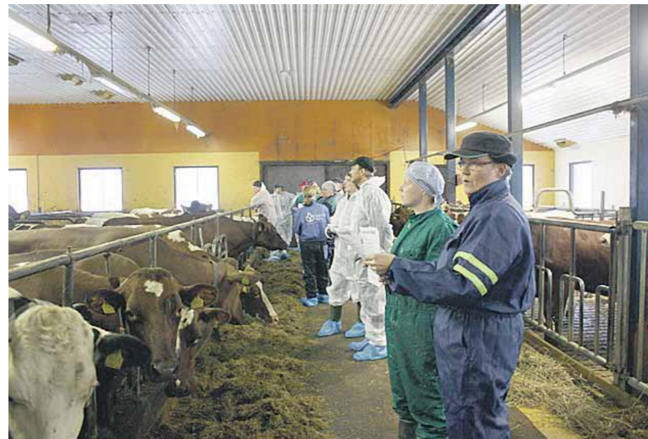
Tammikuussa 2013 pidettiin sorkkahavaintokoulutus Kivelän tilalla Miehikkälässä.

Osuuskunta Tuottajain Maito - Nupit Kaakkoon Kustannusarvio: 519 150 € Julkinen rahoitus: 388 476 € Tuen myöntäjä: Kaakkois-Suomen ELY-keskus