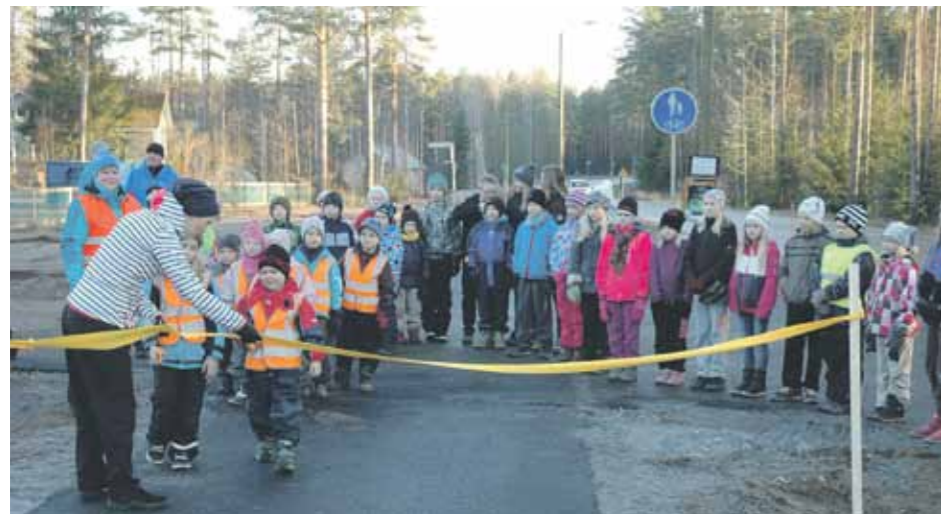
Heituinlahden koululaiset olivat avaamassa kevyen liikenteen väylää.

Heituinlahden kevyen liikenteen väylä Kustannusarvio 350 000 € Julkinen rahoitus 315 000 € Tuen myöntäjä: Kaakkois-Suomen ELY-keskus