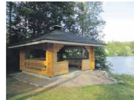
Grillikatoks Tulilammen uimarannalla.

Rautjärven kunta - Asemanseudun vetovoimasuunnitelma Kustannusarvio 90 000 € Julkinen rahoitus 81 000 € Yksityinen rahoitus 9 000 €